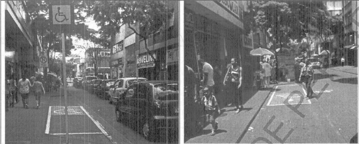
Señalización Horizontal en las Bahías de la Ciudad