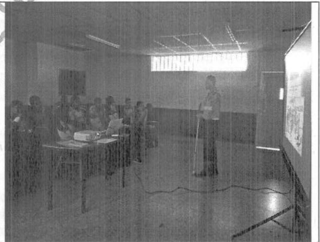
Capacitación de Educador con discapacidad Visual.